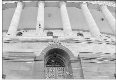
बीमा क्षेत्र में प्रत्यक्ष विदेशी निवेश की सीमा बढ़ाकर 74 फीसद करने का प्रावधान

संसद ने 'बीमा (संशोधन) विधेयक-2021' को मंजूरी प्रदान कर दी, जिसमें बीमा क्षेत्र में प्रत्यक्ष विदेशी निवेश (एफडीआई) की सीमा बढ़ाकर 74 फीसद करने का प्रावधान किया गया है। लोकसभा में सोमवार को इस विधेयक को मंजूरी दी गई जबकि पिछले सप्ताह गुरुवार को राज्यसभा में विधेयक पारित हुआ था। निचले सदन में विधेयक पर हुई चर्चा का जवाब देते हुए वित्त मंत्री निर्मला सीतारमण ने कहा कि बीमा क्षेत्र में प्रत्यक्ष विदेशी निवेश की सीमा बढ़ाकर 74 फीसद करने से इस क्षेत्र की कंपनियों की बढ़ती पूंजी जरूरत को पूरा करने में मदद मिलेगी। सीतारमण ने कहा कि यह संशोधन इसलिए किया जा रहा है कि कंपनियां यह तय कर सकें कि उन्हें किस सीमा तक एफडीआई लेना है। उन्होंने कहा कि बीमा क्षेत्र अत्यंत विनियमित क्षेत्र है जिसमें हर चीज, यहाँ तक कि निवेश से लेकर विपणन तक का विनियमन होता है। उन्होंने कहा कि बीमा कंपनियां तरलता के दबाव का सामना कर रही हैं। बीमा क्षेत्र में प्रत्यक्ष विदेशी निवेश की सीमा बढ़ाकर 74 फीसद करने से इस क्षेत्र की कंपनियों की बढ़ती पूंजी जरूरत को पूरा करने में मदद मिलेगी। वित्त मंत्री ने कहा कि बीमा