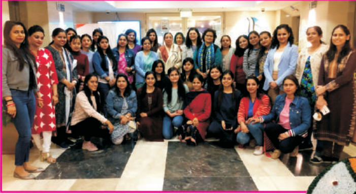
कार्पोरेट कार्यालय, ईस्ट किडवई नगर, नई दिल्ली