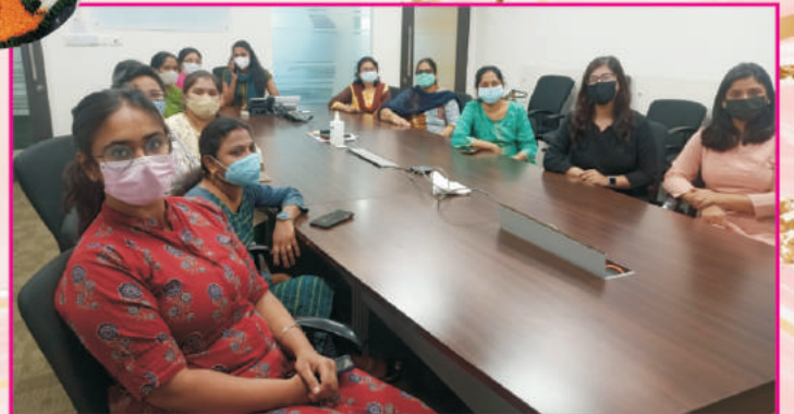
दक्षिणी क्षेत्रीय कार्यालय, सिकन्दराबाद