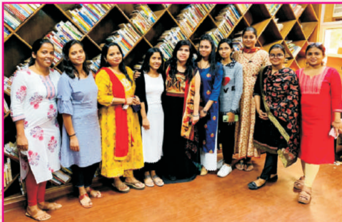
उत्तर रेलवे के दिल्ली मंडल में कार्यरत रेलटेल एच.एम.आई.एस. टीम