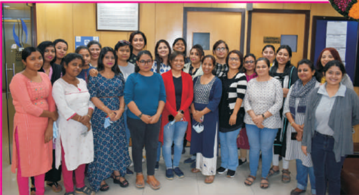
पूर्वी क्षेत्रीय कार्यालय, कोलकाता