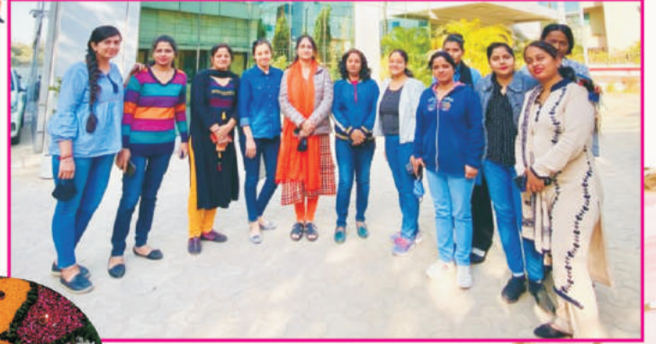
एनसीआर टेरिटरी, गुरुग्राम