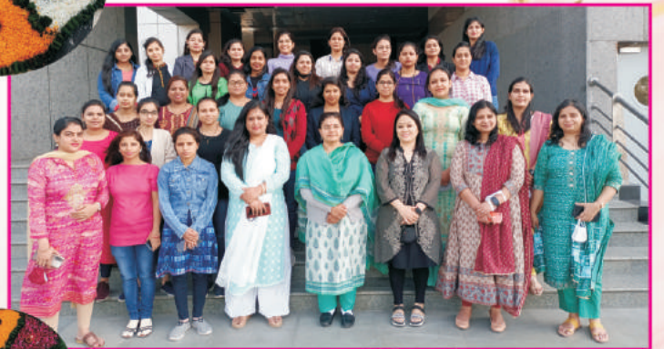
उत्तरी क्षेत्रीय कार्यालय, शारजी पार्क, नई दिल्ली