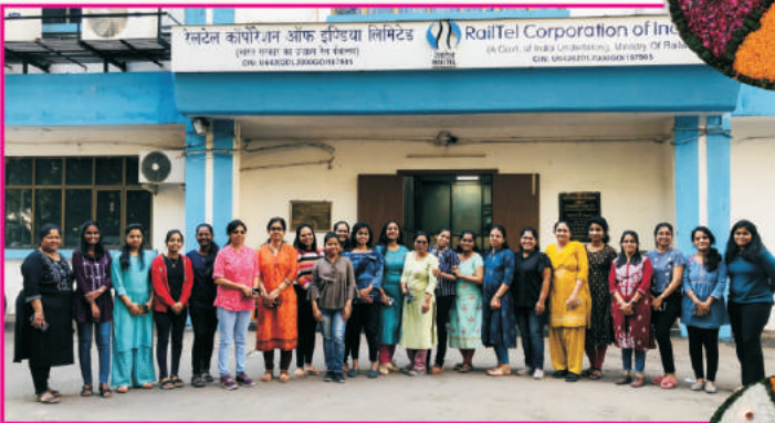
क्षेत्रीय कार्यालय, पश्चिमी क्षेत्र, मुंबई